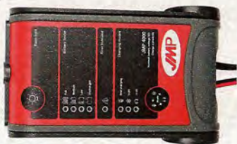
JMP 4000, Preis: 69,95 Euro