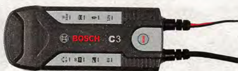
Bosch C3, Preis: 58 Euro