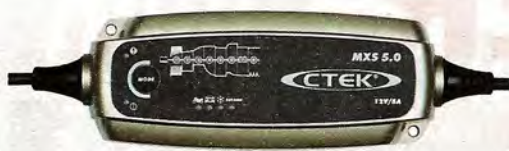
CTEK MXS 5.0, Preis: 79,95 Euro