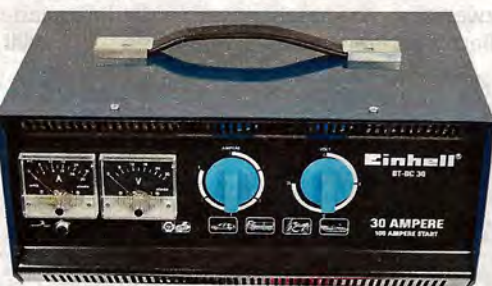
Einhell BT-BC 30, Preis: 89,90 Euro