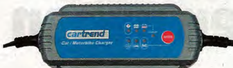
Cartrend MP 3800, Preis: 45,90 Euro