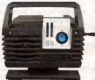
Waeco Perfect Charge, Preis: 74,95 Euro