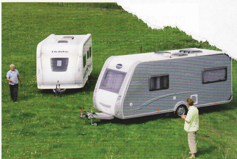
Moverne blev brugt intensivt i flere dage på både asfalt og i højt græs.

Og så er der stedbarnet Camper Trolley, som på mange måder overrasker positivt, og som man sparer mange penge på. Funktionaliteten er noget anderledes og kræver mere af brugeren end de andre movere mht. styring og fastgørelse. Den er et spændende bud på en mover til mellemtunge caravans.