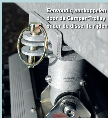
Eenvoudig aankoppelen door de Camper-Trolley onder de dissel te rijden

rond z'n as alsof die niets weegt. Op de 10%-helling met klinkertjes heeft hij het al moeilijker. Hoewel we de kogeldruk op de gewenste 70 kilo brengen, helpt alleen extra gewicht op de dissel de 1.300 kg wegende caravan de helling op. 't Is overigens beter deze mover te laten duwen, dan heeft hij de meeste kracht. Maar zelfs met de extra kilo's voorop schort het af en toe aan grip en is rechtdoor omhoogrijden nauwelijks mogelijk. Uitgeschakeld staat de Camper-Trolley ook niet vast op z'n plek, maar rolt-ie langzaam terug. Vergeleken met de chassis gemonteerde movers een matig resultaat.